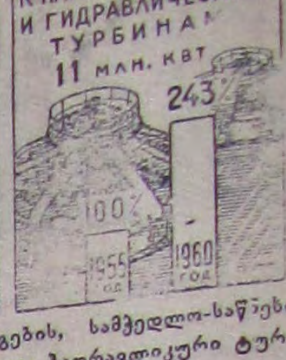
1960 წლის ბოლოსათვის ლითონმკრები დაზავების, სამკედლო-საწებო მანქანებისა და ორთქლის გენერატორების, გაზისა და ჰიდრავლიკური ტურბინების წარმოების მოცულობა.