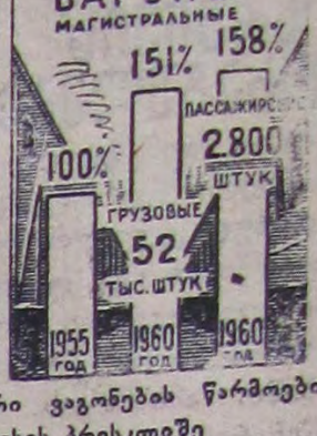
ელმავლების, თბომავლებისა და მაგისტრალური ვაგონების წარმოების მოცულობა.