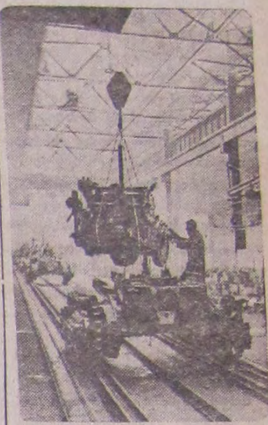
ჩელოაბინსკი, ჩელოაბინსკის სატრაქტორო ქარხნის კონსტრუქტორებმა მოახდინეს ტრაქტორ „ს-80“-ის მოდერნიზება, გაზარდეს მისი სიმაღლე 100 ცენტის ძალამდე. მიმდინარე წელს ქვეყანა მიიღებს ათასობით ახეთ მანქანას. სურათზე: 100-ძალიანი ძრავის დადგმა ტრაქტორზე.

პოლონეთის გაერთიანებული მუშათა პარტიის ცენტრალური კომიტეტი და სსრ კავშირის მინისტრთა საბჭო ითვალისწინებენ რა, რომ ჩვენს ქვეყანაში აქვს ხალხის ცხოვრების დონის ამაღლების საქმეში, მოითხოვენ ყველა პარტიული, საბჭოთა, პროფკავშირული და სამეურნეო ორგანოსაგან ბოლო მოუყურადღება მიაქციონ ამ საქმეს და უახლოეს დროში მიაღწიონ მოსახლეობის მომსახურების ძირეულ გაუმჯობესებას.